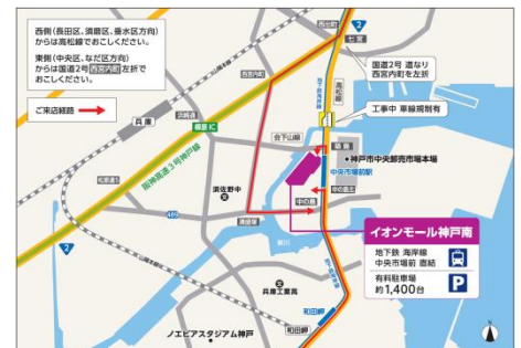
神戸市営地下鉄海岸線「中央市場前」駅直結