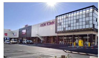
イオンタウン成田富里内にオープン！