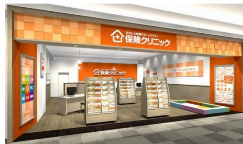
新小松店の店舗イメージ。