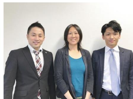
経験豊富なコンサルタントが、いつも笑顔でお迎えます。