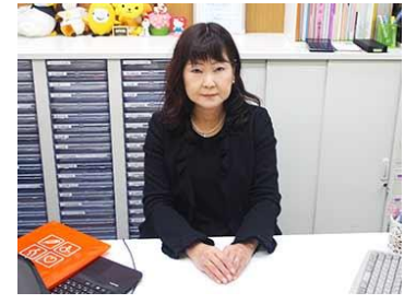
分からないことや気になること、何でもお聞かせください。