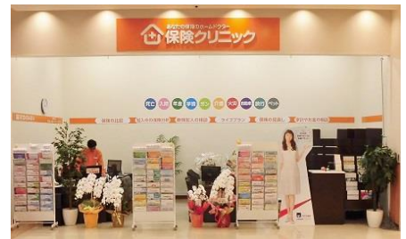
店内には 4 つの独立したテーブルがあり、相談しやすい雰囲気です。