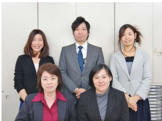
苫小牧店スタッフ集合写真

1999 年に日本で初めてオープンした保険ショップです。日本の約 90%の世帯が加入している生命保険を、視覚的に分かりやすくご説明するために、保険分析・比較システム『保険 IQ システム』を独自に開発しています。保険商品の検索や比較の機能を追加し、保険の現状把握からお客様に合わせたプランのご提案まで、全国の『保険クリニック』で質の高い均一のサービスの提供の一端を担っています。