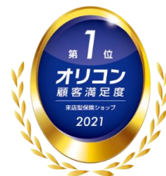
2020年・2021年 オリコン顧客満足度®調査 来店型保険ショップ 総合1位

1999年に日本で初めて*オープンした保険ショップです。 「あなたの保険のホームドクター」をモットーに、コンサルタントの主観に偏らず、わかりやすく納得できる保険選びをお手伝い致します。 また、保険が必要になった時のフォローや、ライフイベントに応じた保障内容の見直しなど、長く安心して人生を歩んで頂くためのアフターサービスにも力をいれております。しつこい勧誘は一切ありません。 (2020年・2021年 オリコン顧客満足度®調査 来店型保険ショップ 2年連続総合1位)