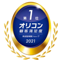
2020年・2021年 オリコン顧客満足度®調査 来店型保険ショップ 総合1位

(2020年・2021年 オリコン顧客満足度®調査 来店型保険ショップ 2年連続総合1位)