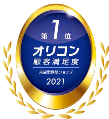
2021年 オリコン顧客満足度®調査 来店型保険ショップ 総合1位