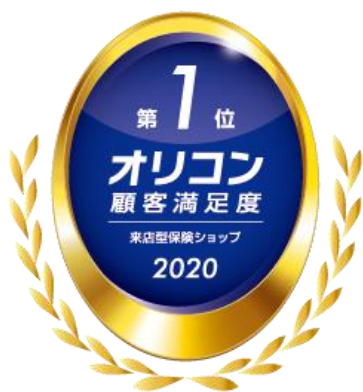
2020年 オリコン顧客満足度®調査 来店型保険ショップ 総合1位

株式会社アイリックコーポレーション(本社:東京都文京区 代表取締役:勝本竜二、証券コード:7325、以下「当社」)は、8月1日(日)に『保険クリニック』島忠ホームズ草加舎人店をリニューアルオープンいたします。 (全国250店舗、関東地区で108店舗、埼玉県で19店舗 2021年8月1日時点) (2020年 オリコン顧客満足度®調査 来店型保険ショップ 総合1位)