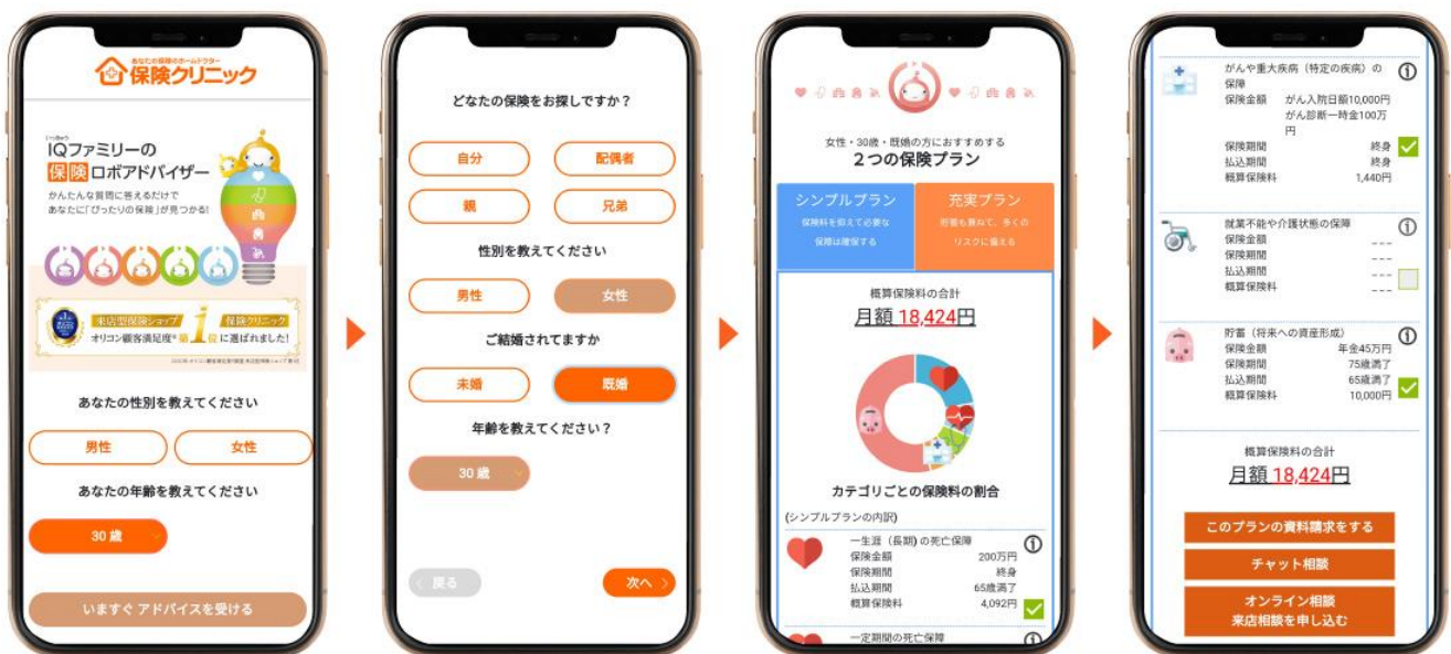
「いっきゅうファミリーの保険ロボアドバイザー」操作イメージ

ロボットだけでは不安な方には、プラン表示後に、チャット、オンライン相談、来店相談など、『保険クリニック』のコンサルタントがアドバイスいたします。