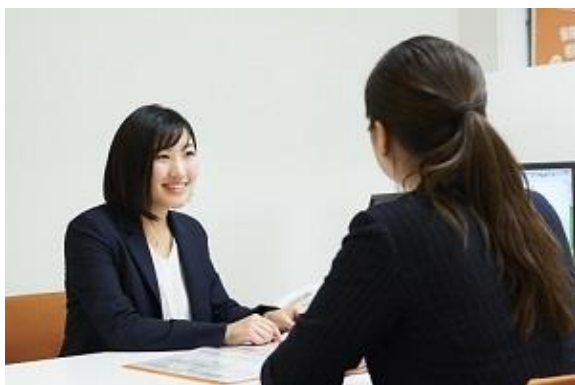
保険だけでなく、家計や資産形成など お金まわりの様々なご相談にお応えしております。

「人と保険の未来をつなぐ ～Fintech Innovation～」をきっかけ、保険販売事業、ソリューション事業、システム事業を手掛ける株式会社アイリックコーポレーション(本社:東京都文京区 代表取締役:勝本竜二、証券コード:7325、以下「当社」)は、千葉県流山市にて『保険クリニック』流山おおたかの森駅前店をオープンいたします。これにより、全国 185 店舗、関東地区で 71 店舗(千葉県で 20 店舗)となります。(2018 年 11 月 1 日時点)