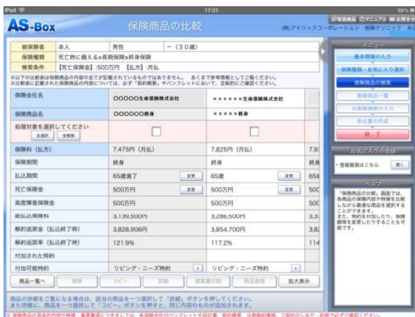
保険商品 比較画面

『AS-BOX』の機能は、アンドロイド搭載のタブレット型端末やiPadでもご利用いただけます。『AS-BOX』のIDを取得後、タブレット機能(オプション)の利用を申請していただくことで、お客様の家の玄関先やお茶の間にて『AS-BOX』とほぼ同様の機能をご利用いただけます。